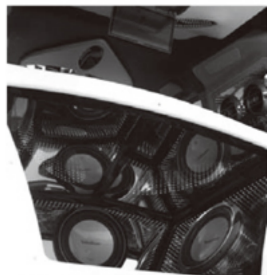
ハードなオーディオメイクもいっぱいありました。ただ立体的なだ けではなく、凹凸の凹を使ったメイクなんか斬新ですよ。

と、無事審査も済ませ、セクシーカスタム AWARDも決定! 内外装のトータルで ハイレベルな新型bBと、キレイにまとまった ダイハツ エッセの2台を選ばせていただき