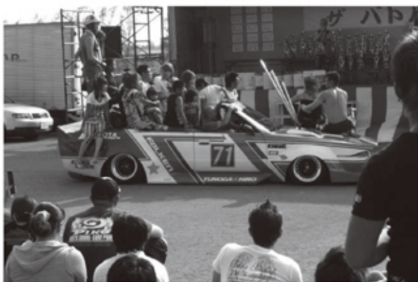
うーん、懐かしい!? いまの時代でもやっぱりこういうクルマはいいですね。見ていると昔の血が騒ぐ...

しかし、今回のイベントの最中に残念な お知らせがありました。前夜祭でお酒を飲 んで、仲間のバイクで転んで、警察のお世話 になってしまった方が出てしまいました。結 果はもちろん...。やはりルールは守ってイベ ントに参加しなくちゃですね! 結局、連 帯責任みたいになってしまいますからね。け ど、これが原因でイベントが中止にならな くてよかったです。