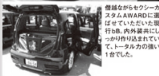
層層ながらセクシーカ スタムAWARDに選 ばせていただいた現 行bB。内外装共にし っかり作り込まれて いて、トータル力の強い 1台でした。